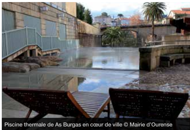
Piscine thermale de As Burgas en cœur de ville