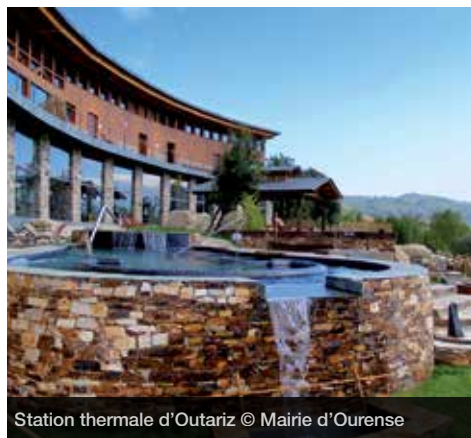
Station thermale d'Outariz

Eaux thermales, histoire et nature se confondent à Ourense afin de créer une destination touristique de bien-être à caractère urbain, dont l'exploitation est récente.