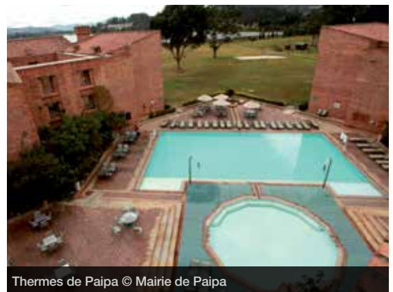
Thermes de Paipa

Le secteur du tourisme de santé et de bien-être ne cesse de croître en Colombie. Il a engendré 220 millions de dollars de revenus directs en 2013, soit 163 millions d'euros, et a vu sa clientèle étrangère augmenter de 60 % pour s'établir à plus 50 000 visiteurs, principalement en provenance des États-Unis, du Canada, du Panama, du Venezuela et d'Espagne. Afin d'accompagner son développement international, plusieurs outils viennent de voir le jour. Le premier est un Outil d'Autoévaluation pour les Organisations Hôtelières, mis au point par le ministère du Commerce. Il s'agit d'un formulaire que les hébergeurs complètent afin de savoir dans quelle mesure ils répondent aux critères standards internationaux. Le but est de leur permettre de mettre en œuvre des actions correctives et des stratégies de développement. Le second est un label de qualité, « Colombia es Salud, Exportador de Servicios de Salud y Bienestar (la Colombie est la santé, exportatrice de services de santé et de